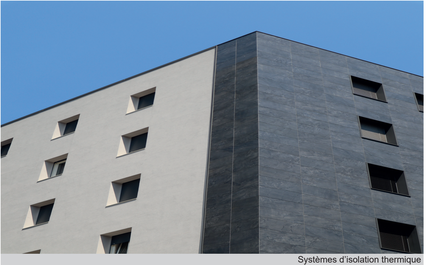
Systèmes d'isolation thermique