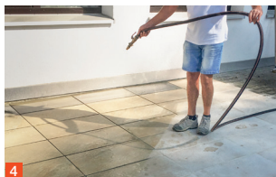
4 Zmočite z vodo