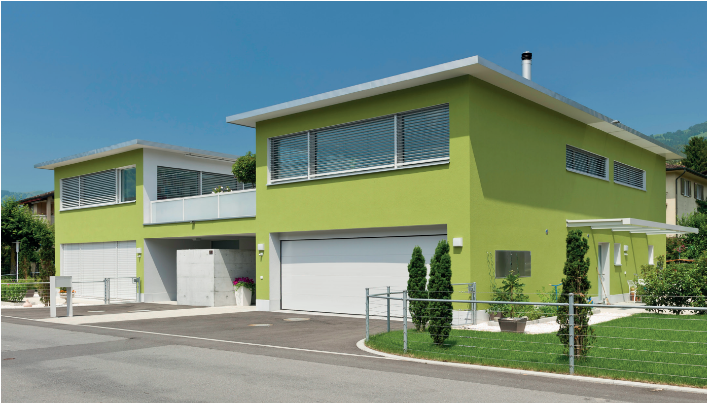
GreoTherm® Système K