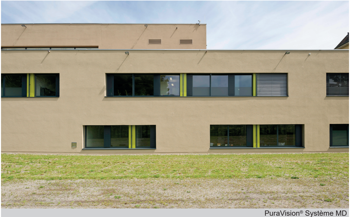
PuraVision® Système MD