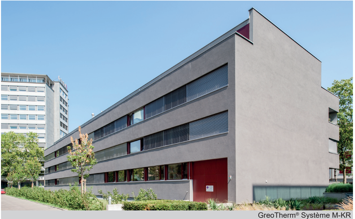
GreoTherm® Système M-KR