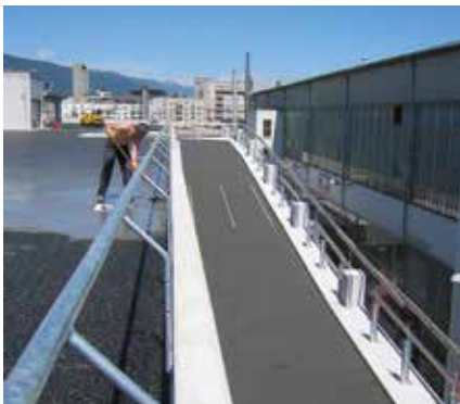
Aires de stationnement pour voitures et poids lourds