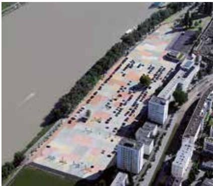
Zones de stockage industrielles