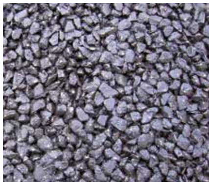
Structure de support à base d'asphalte

Les revêtements de sol semi-rigides du type Creteo®Phalt sont constitués d'un support lié avec du bitume dans lequel les espaces vides sont ensuite remplis avec un mortier fluide Creteo®Phalt de façon à obtenir une couche compacte, qui combine de façon extraordinaire les caractéristiques du mortier à haute résistance avec la flexibilité du système bitumineux. Tout ça est réalisé avec la pose d'un support à base d'asphalte avec un contenu en vides du 25-30 % qui dans une phase successive sont remplis en versant au dessus un des mortiers à haute résistance Creteo®Phalt.