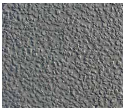
Creteo®Phalt - Revêtement fini

Les mortiers Creteo®Phalt ont été expressément développés pour le remplissage complet des espaces vides de la structure de support à base d'asphalte. Le temps de prise extrêmement court en combinaison avec le développement très rapide de la résistance mécanique du mortier Creteo®Phalt permet d'employer et charger la surface après 12 à 18 heures seulement. Les mortiers Creteo®Phalt sont élaborés contre le retrait de façon à réduire la formation de microfissures en surface ainsi que de fissures plus nuisibles dans la construction.