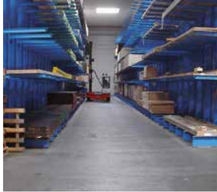
Halles de stockage