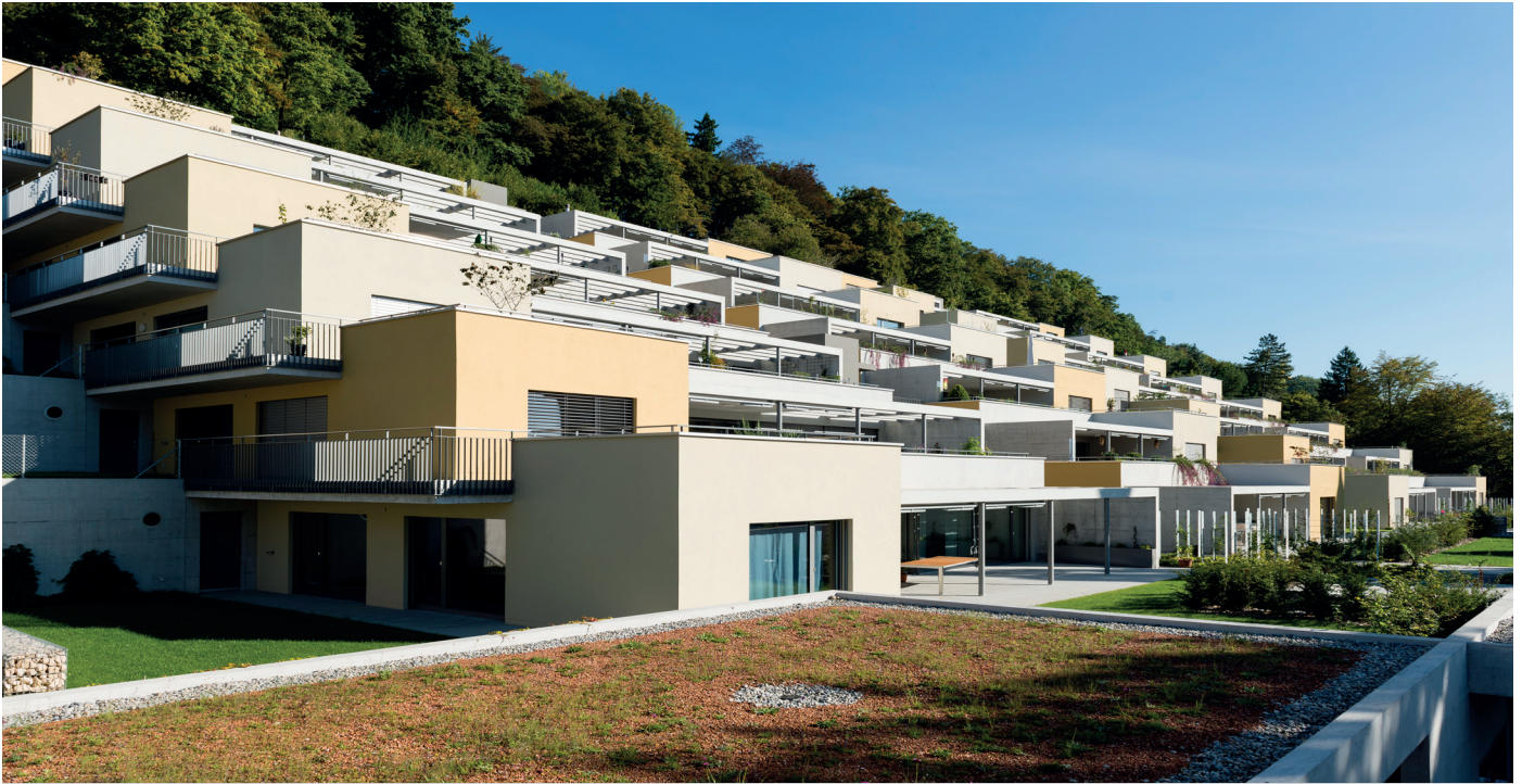
GreoTherm® Système K