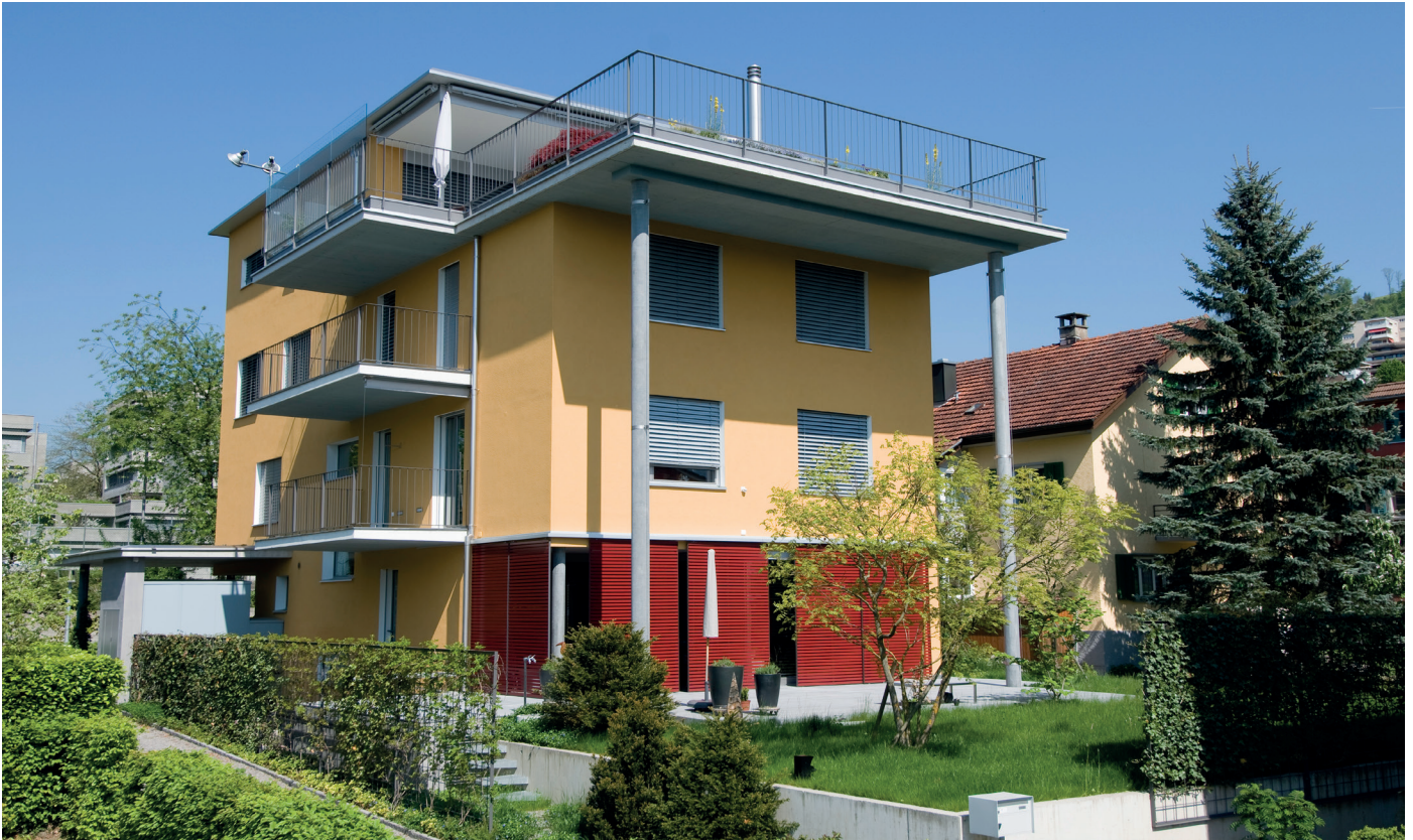
PuraVision® Système KD